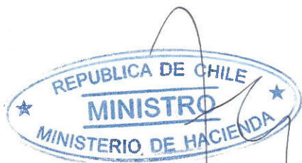
Ignacio Briones Rojas Ministro de Hacienda

Agradeciendo su consideración y sin otro particular, saluda atentamente a Ud.,